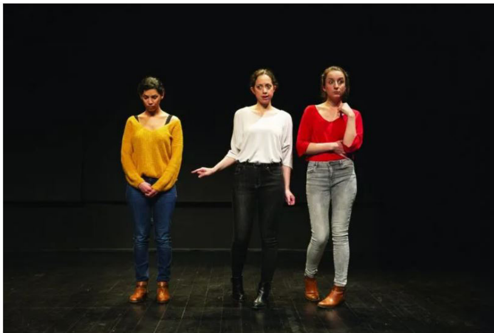
"Tous nos Ciels" - © Sandy Korzekwa

par L'Art-vues | Nov 18, 2022 | Gard, Spectacles vivants, Théâtre | 0 commentaires