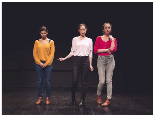
"Tous nos Ciel", deuxième création du Collectif V.1

🕒 Temps de lecture 51 sec 🕒 vendredi 18 novembre 2022