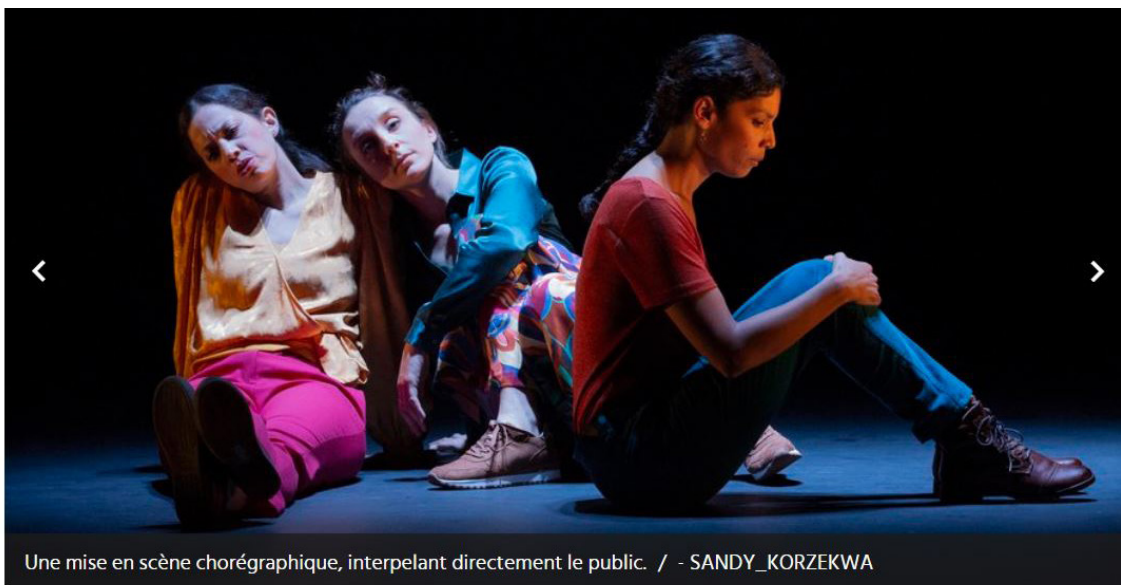
Une mise en scène chorégraphique, interpellant directement le public.

Le Collectif V.1 créé sa nouvelle pièce "Tous nos ciels", à l'Odéon à Nîmes, en s'inspirant de l'histoire des enfants réunionnais arrachés à leurs familles pour repeupler les campagnes françaises.